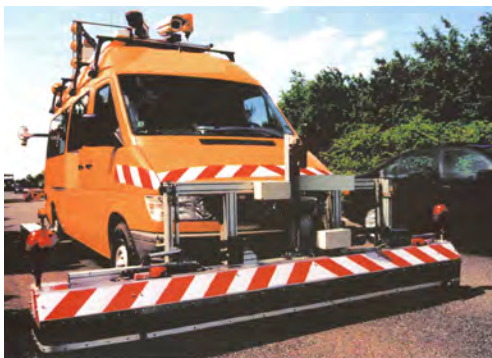
Zustandserfassung mit Messfahrzeug